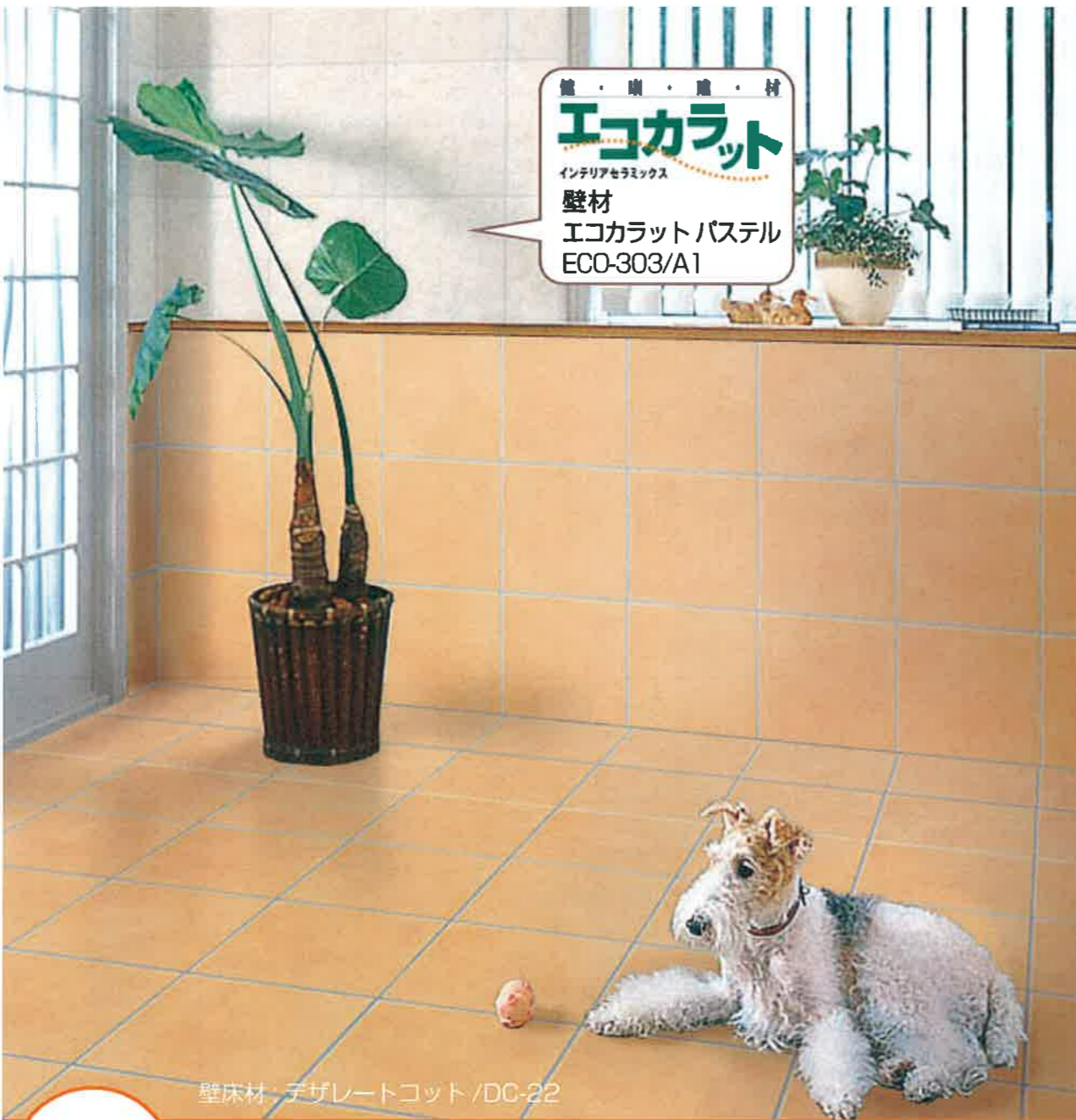
壁床材: 子ザレトコット/DC-22