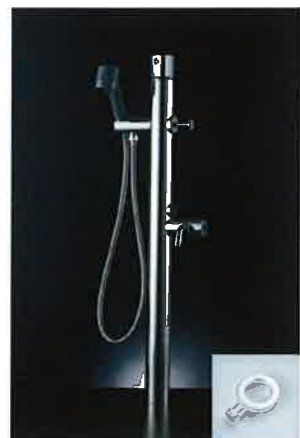
シングルレバー混合水栓 (キー式ハンドル1ヶ付) LF-932SGHK ¥109,000