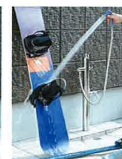
▲汚れ落としにも使えます