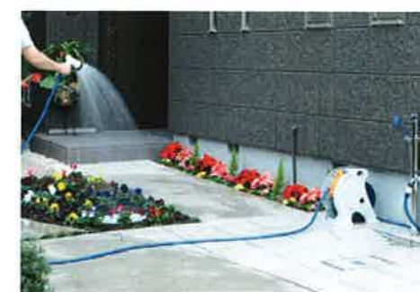
▲市販のホースと組み合わせ広範囲に散水