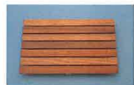
使い勝手の用途が広がります。 すのこ A-5339 ¥7,700