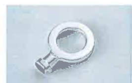
キー式ハンドル 61-1187 ¥2,900