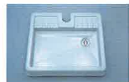
水じまいが良く排水の処理がカンタンです。 専用防水パン A-5338 ¥19,800