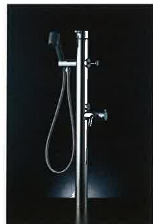
シングルレバー混合水栓 LF-932SHK ¥99,000