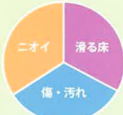
愛犬家の住まいの悩み

この「滑る床」「傷・汚れ」「ニオイ」という愛犬家の3つの大きな悩みは、建材を選ぶことで大幅に低減することができます。